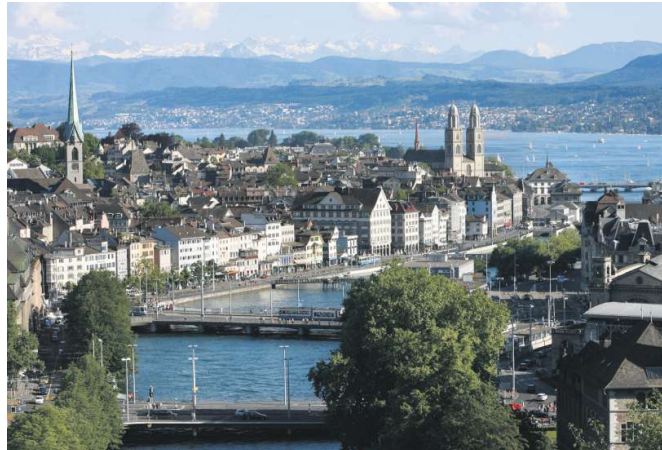
Das Zürcher Grossmünster vor der Alpenkulisse. In der Schweiz bremsen die direkte Demokratie und der Steuerwettbewerb die Ausgabenfreude von Politikern.